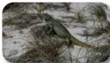
Les iguanes sont légion sur Water Cay, comme la faune en général aux Turks & Caicos.

La plus verdoyante de l'archipel, c'est l'île des réserves naturelles qui abritent des colonies de flamants roses. Elle fait le bonheur des randonneurs.