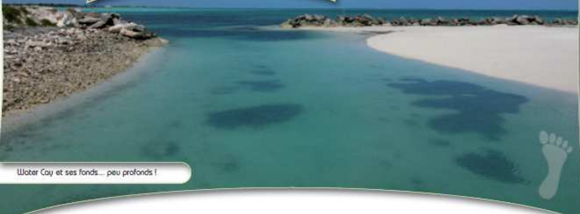
Water Cay et ses fonds... peu profonds !