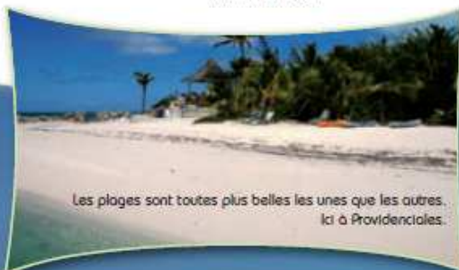
Les plages sont toutes plus belles les unes que les autres... Ici à Providenciales.