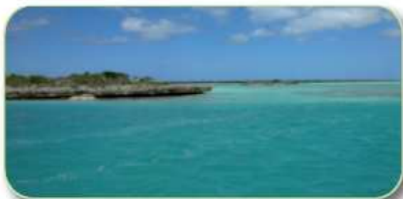
Si les hauts-fonds offrent de beaux sharkeling, il vaut mieux bien connaître les passes pour entrer et sortir des lagons...

retraite caraïbe abritée des regards, et aux amateurs de voile une nouvelle destination exotique encore confidentielle. Caicos Sailing vous emmène en cata à la découverte de cette quarantaine d'îles qui forment l'archipel. Seules 8 d'entre elles sont habitées. Autant dire que vous ne serez pas dérangés par les voisins de mouillage. Des kilomètres de plages de sable