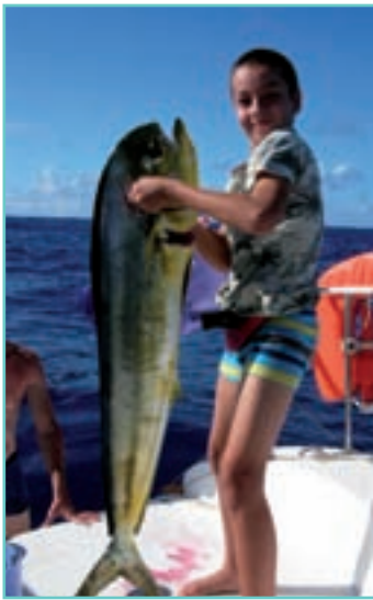
Pendant la transat à bord d'Oteka : on prend du plaisir à vivre ensemble, tout simplement.

familles, car "pour le voyage, le cata c'est le top !"